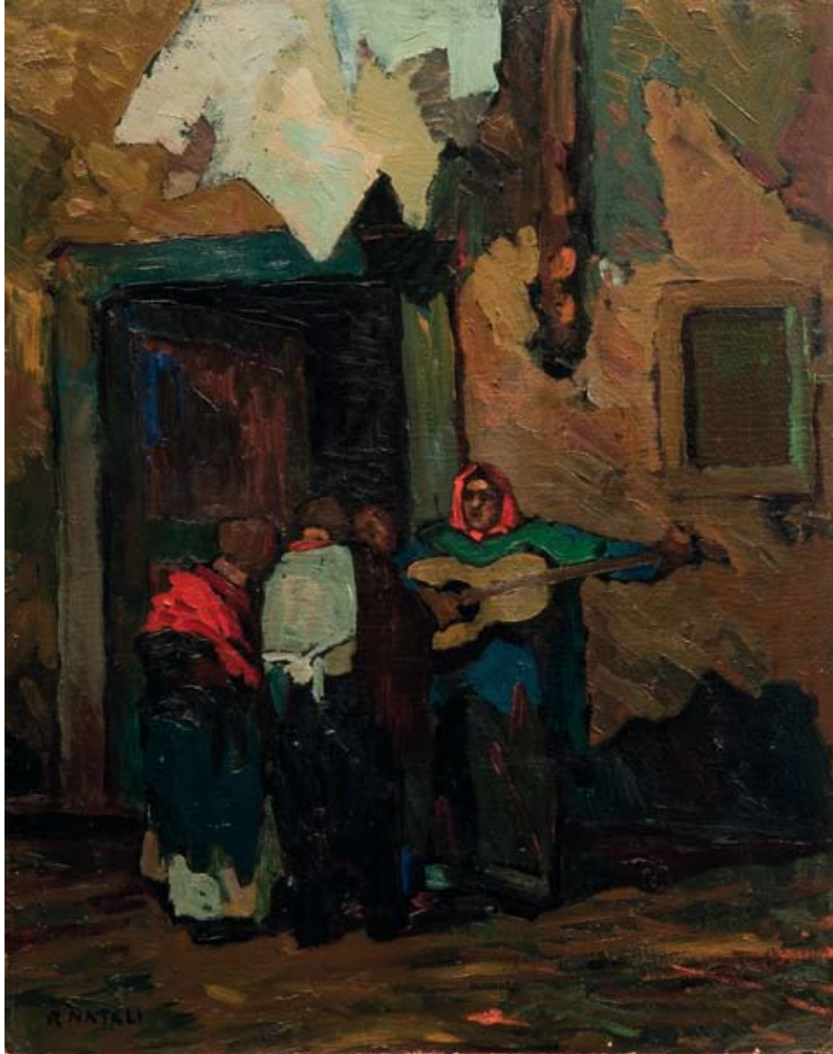
Renato Natali Serenata 1915 circa olio su cartone, cm. 59,5x47 firmato in basso a sinistra