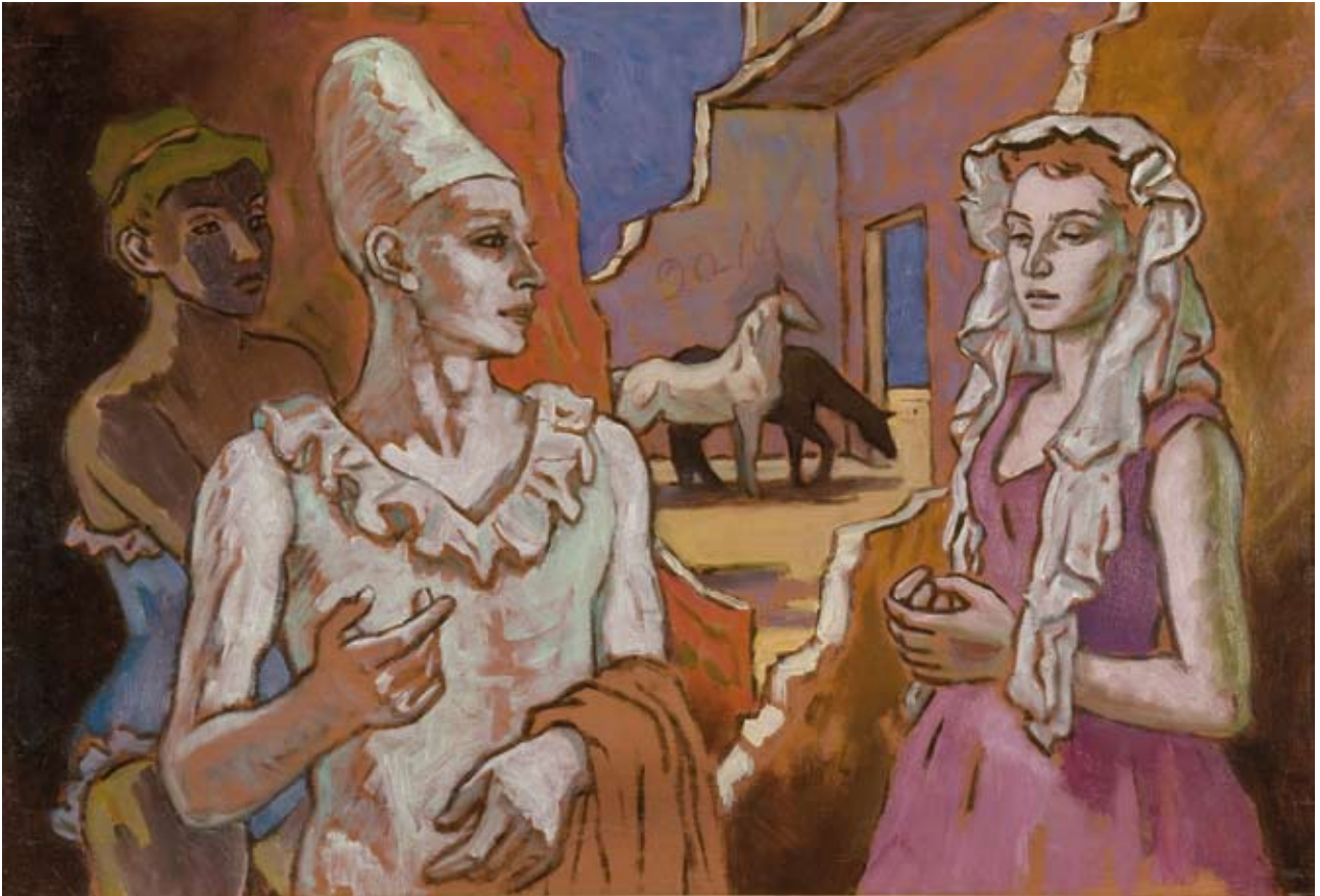
RAM Saltimbanchi olio su tavola, cm. 50,3x73,3