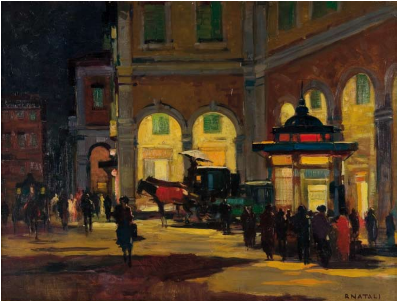
Renato Natali Piazza Grande – Logge del Pieroni – olio su tavola, cm. 60x80 firmato in basso a destra