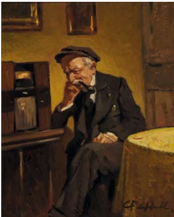
Cafiero Filippelli Ascoltando la radio 1935 circa olio su tavola, cm. 33x26,3 firmato in basso a destra