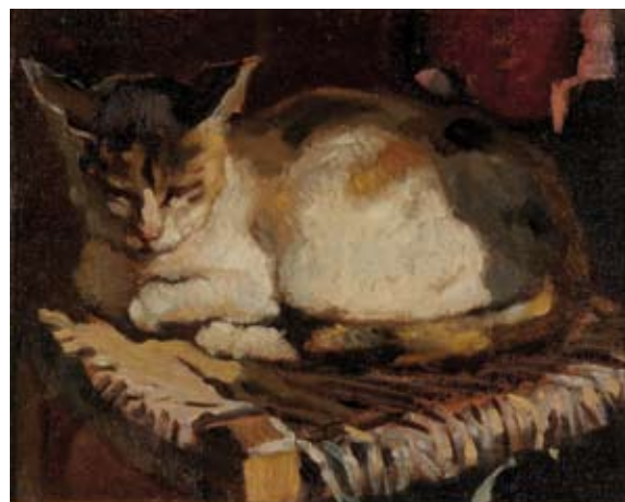
Cafiero Filippelli Il gattino 1930 olio su cartone telato, cm. 21,6x25,8 firmato in basso a sinistra datato sul retro