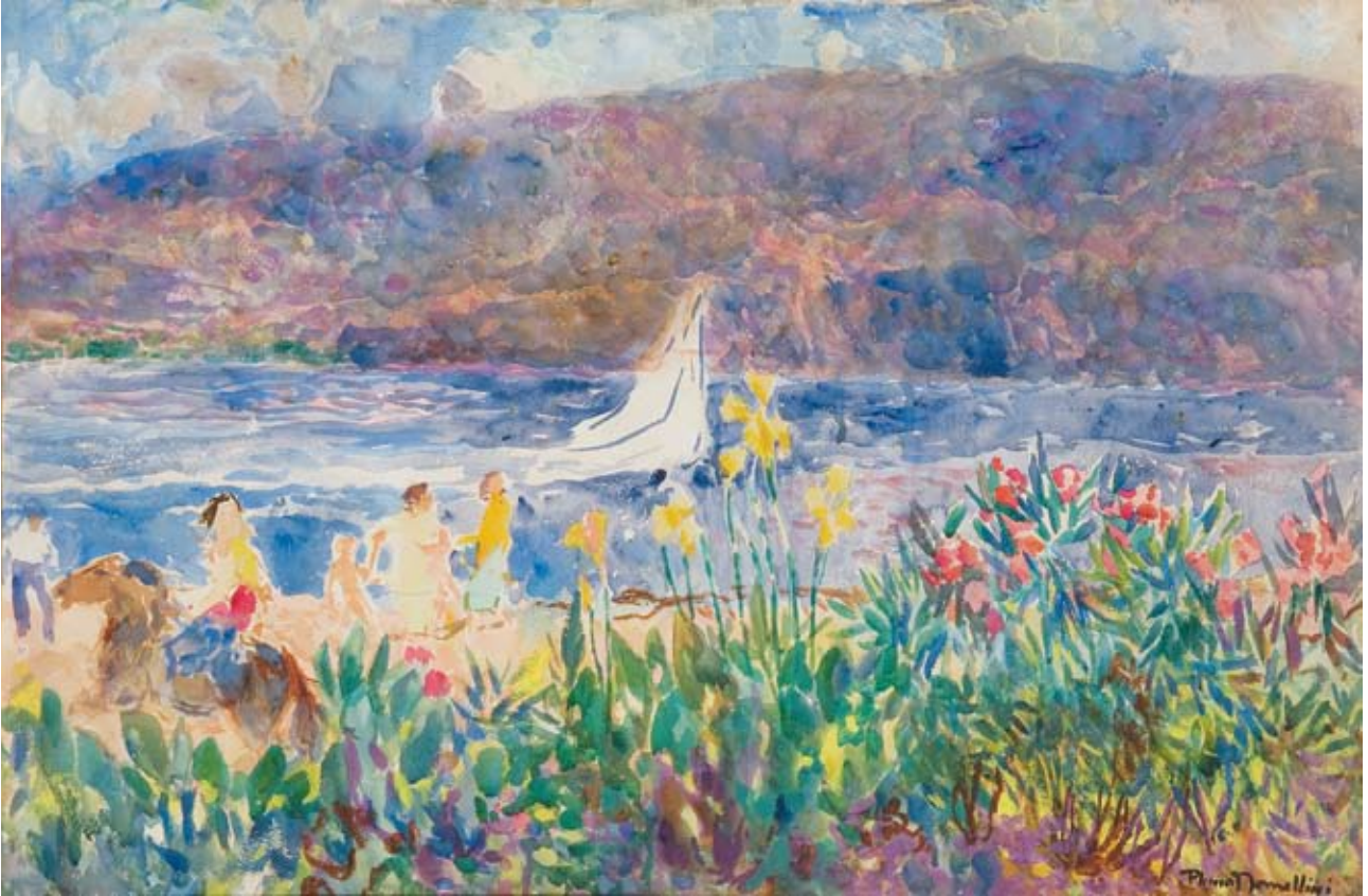
Plinio Nomellini Maestrale elbano acquerello su cartone, cm. 70x100 firmato in basso a destra