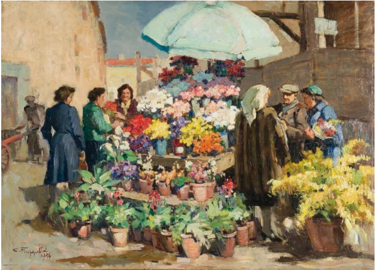
Cafiero Filippelli Angolo del fiore 1954 olio su tavola, cm. 50x70 firmato e datato in basso a sinistra