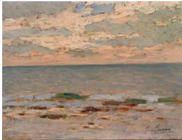
Giovanni Lomi Marina 1931 olio su tavola, cm. 14,5x19,5 firmato in basso a destra