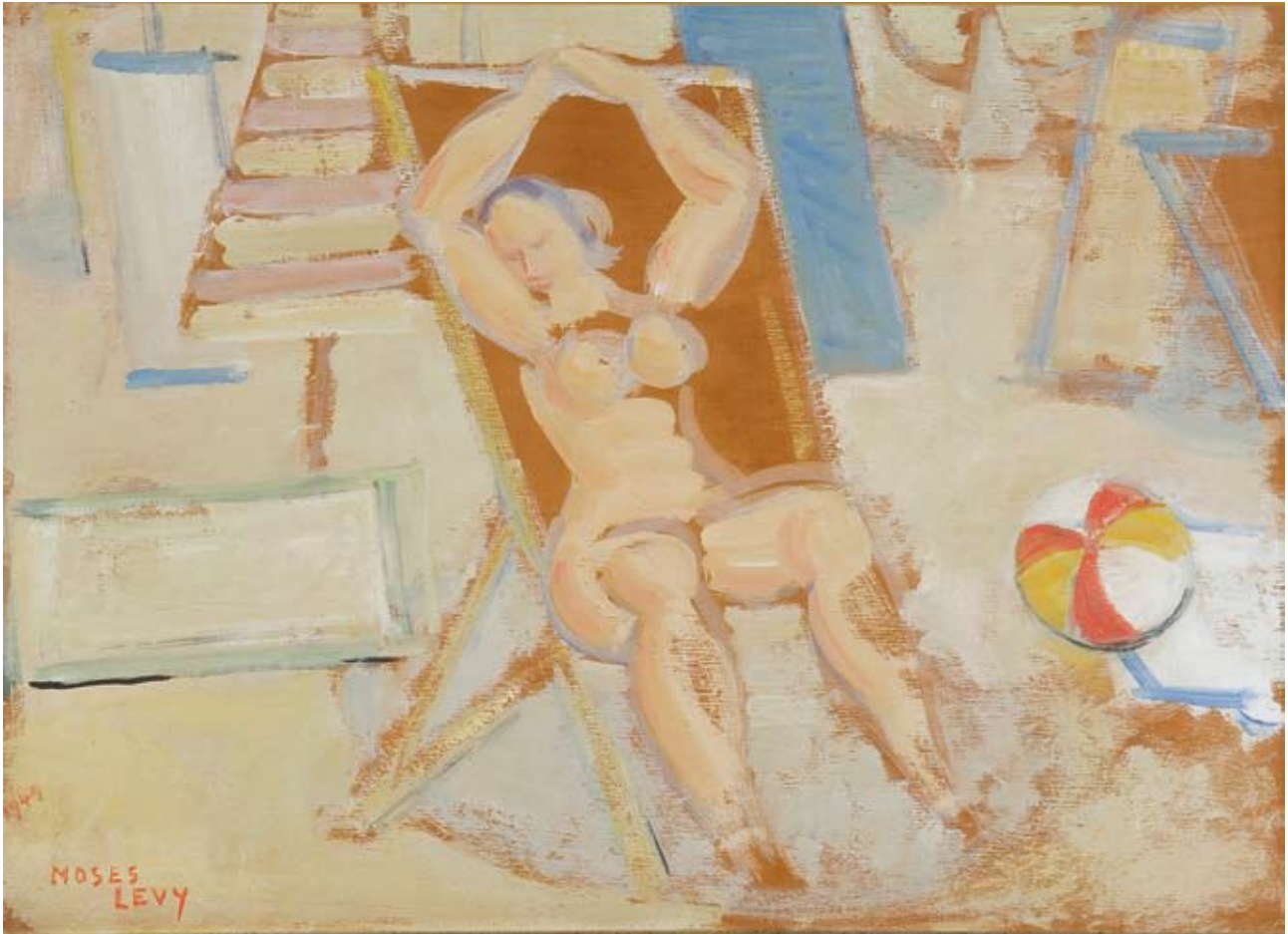
Moses Levy Sulla spiaggia 1949 olio su tavola, cm. 33x46 firmato e datato in basso a sinistra