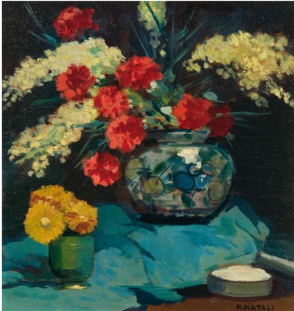
Renato Natali Composizione floreale anni '30 olio su tavola, cm. 33,5x31 firmato in basso a destra