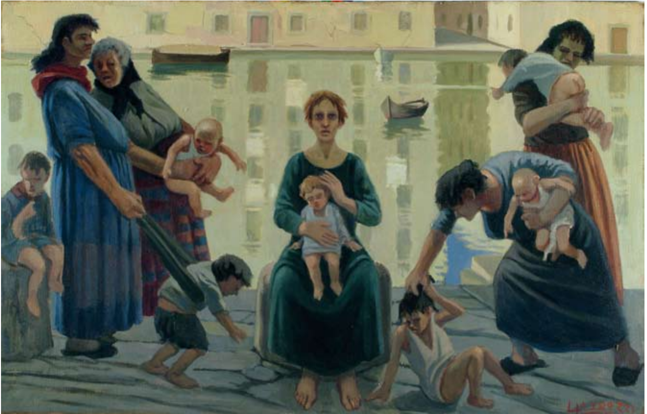
Lando Landozzi Buone e cattive madri olio su masonite, cm. 80x124 firmato in basso a destra