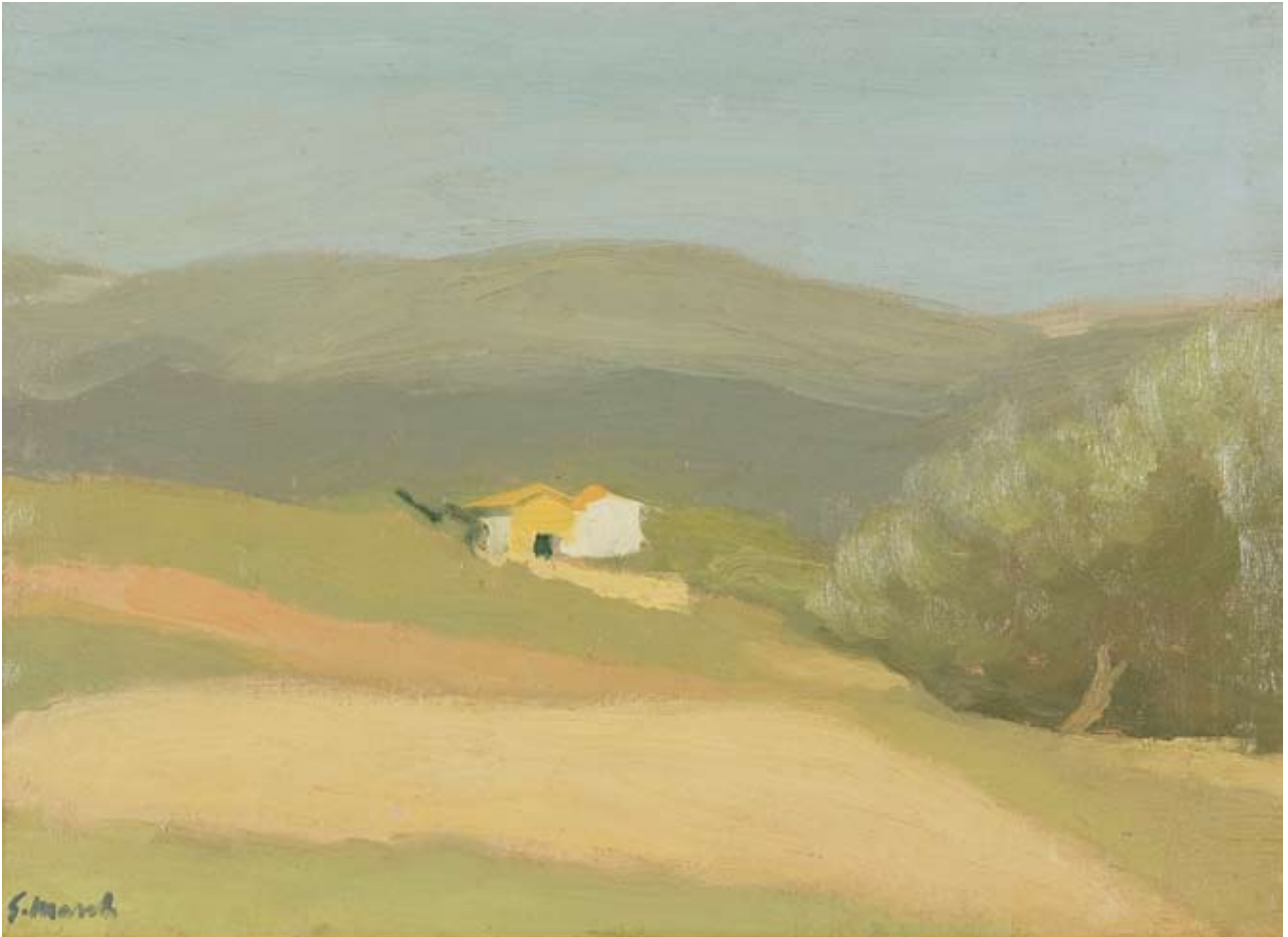
Giovanni March Paesaggio a Mastiano olio su tela, cm. 39,5x53 firmato in basso a sinistra