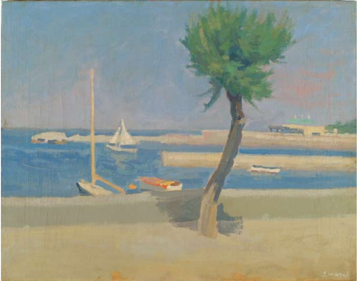
Giovanni March Bagni Fiume 1957 olio su tela, cm. 55x70 firmato in basso a destra firmato e datato sul retro