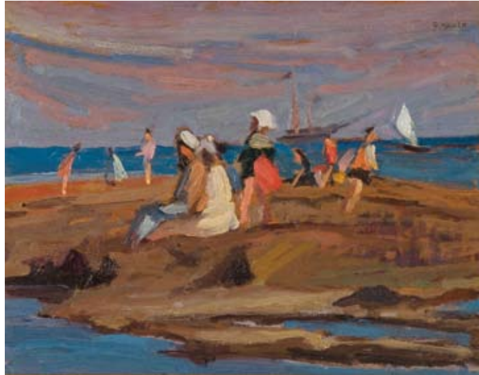
Giovanni March Bagnanti sugli scogli olio su tavola, cm. 27,8x35,2 firmato in alto a destra