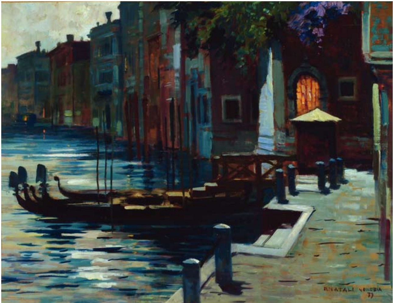
Renato Natali Venezia – Canal Grande – 1939 olio su tavola, cm. 51,5x68 firmato, datato e titolato “Venezia” in basso a destra